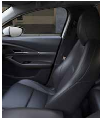
ZWART LEDEREN INTERIEUR