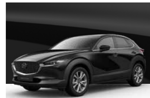
JET BLACK | € 850