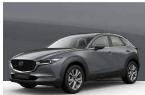
POLYMETAL GREY | € 850