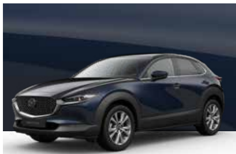
DEEP CRYSTAL BLUE | € 850