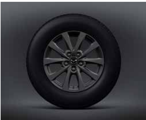
16-INCH LICHTMETALEN VELGEN, GREY