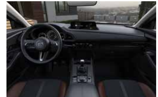
Dashboard afgewerkt met terracotta-kleurig stiksel