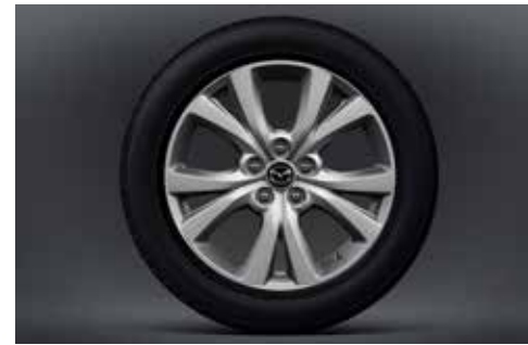
18-inch lichtmetalen velgen in Silver