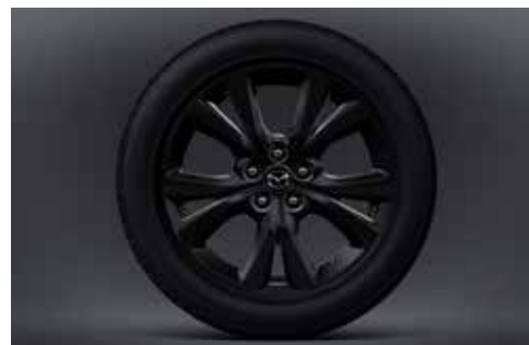
18-inch lichtmetalen velgen in Black