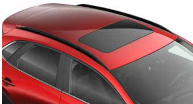
ROOFRAILS SILVER € 655 / BLACK € 680