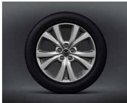
18-INCH LICHTMETALEN VELGEN, SILVER