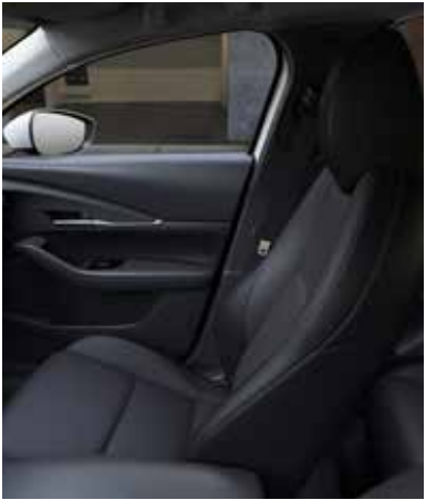
DONKERGRIJS STOFFEN INTERIEUR