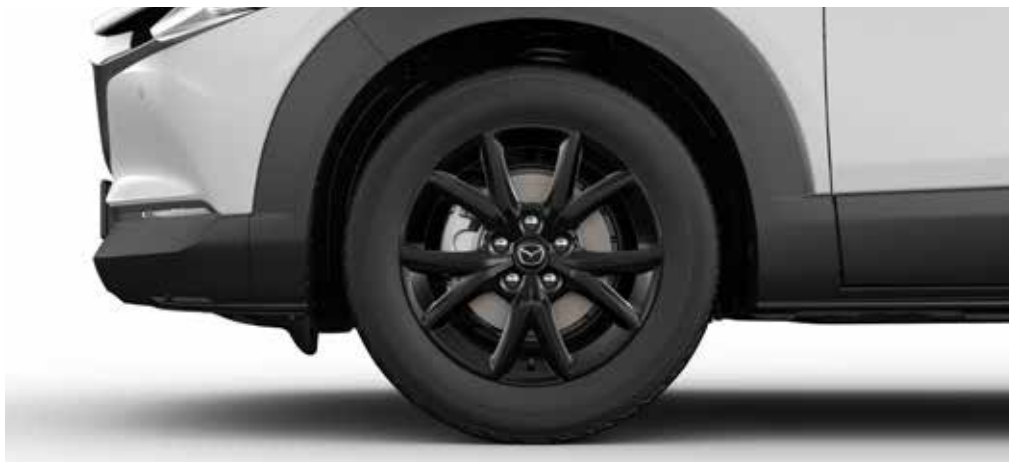
18-INCH LICHTMETALEN VELGEN € 2.100