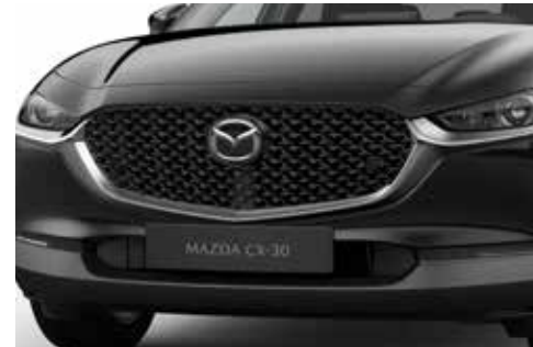
Grille in Piano Black