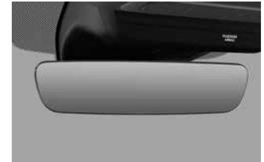
Automatisch dimmende binnenspiegel met randloos design