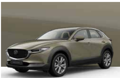
ZIRCON SAND | € 850