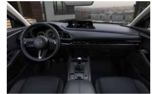
Details interieur in Satin Chrome