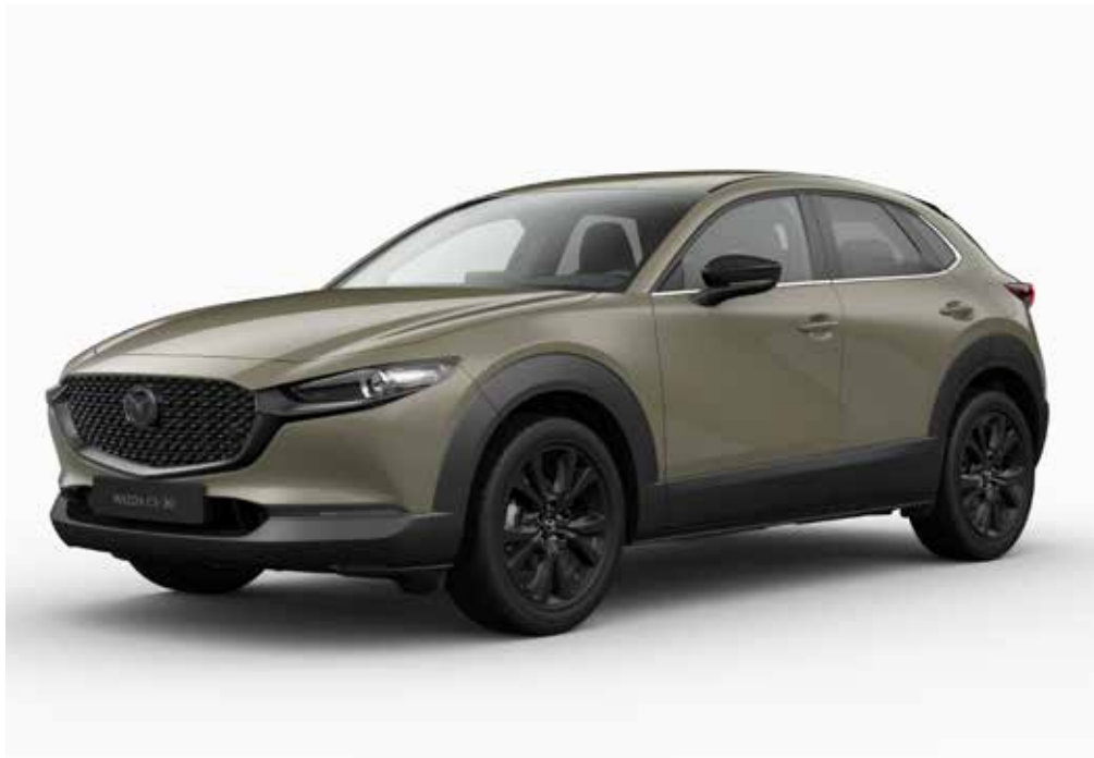
Foto: Mazda CX-30 in Zircon Sand