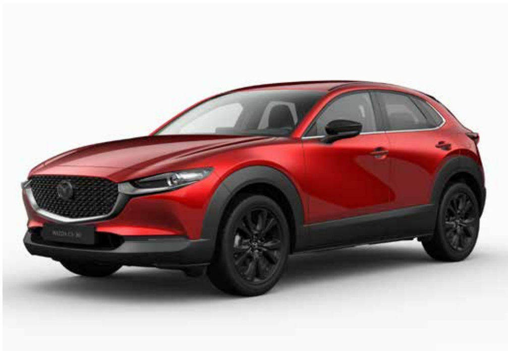
Foto: Mazda CX-30 in Soul Red Crystal