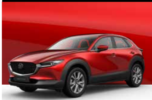
SOUL RED CRYSTAL | € 1.200

Ontdek alle kleuren in de interactieve prijslijst: