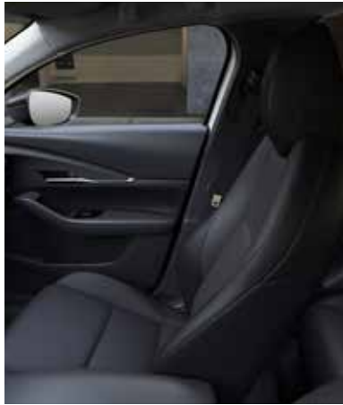
ZWART STOFFEN INTERIEUR MET ROOD STIKSEL