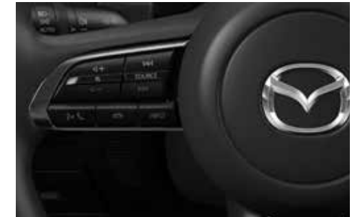
Stuurwielbediening voor spraakbesturing, muziek, telefonie en cruise control