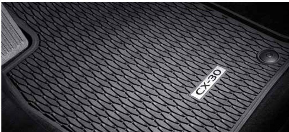
ALL WHEATHER MATTENSET € 100