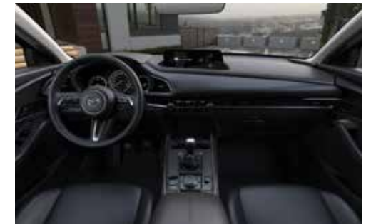
Zwart lederen interieur