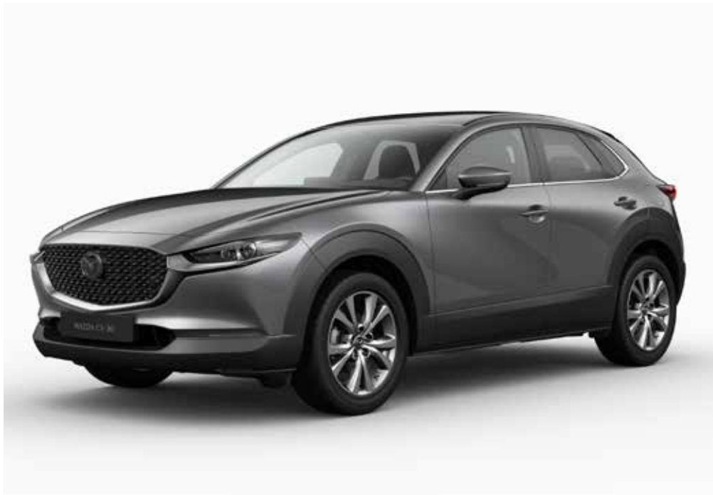
Foto: Mazda CX-30 in Machine Grey