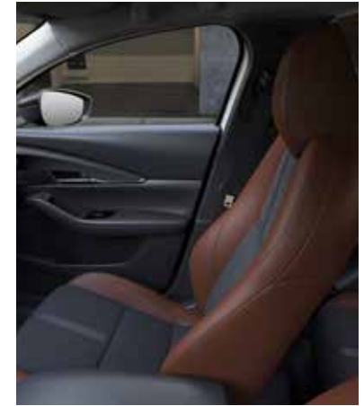
TERRACOTTA KUNSTLEDEREN INTERIEUR MET ZWART KUNSTSUÈDE ZITTING EN TERRACOTTA-KLEURIG STIKSEL