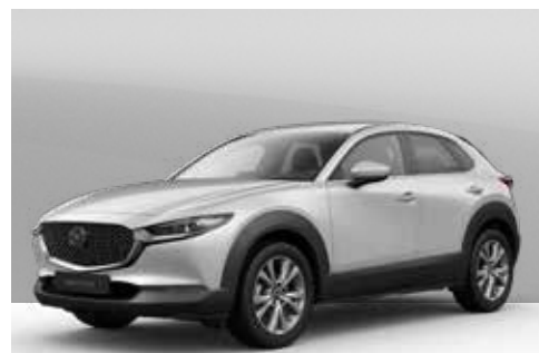
CERAMIC WHITE | € 850