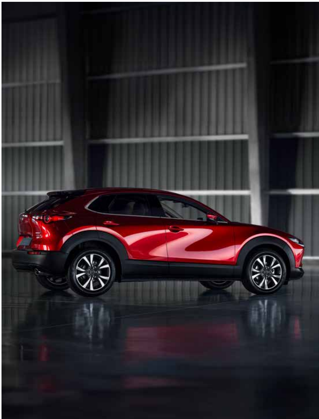
Foto: Mazda CX-30 in Soul Red Crystal