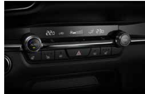
Climate Control, automatische airconditioning in twee zones en ventilatie voor de achterpassagiers