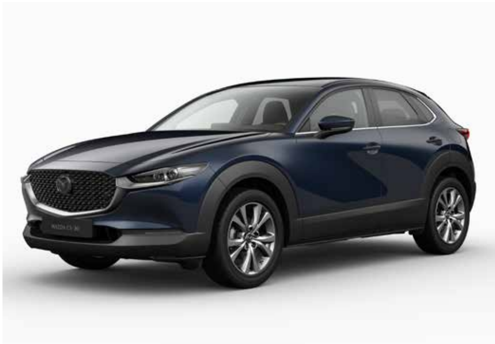
Foto: Mazda CX-30 in Deep Crystal Blue