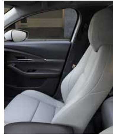
PURE WHITE LEDEREN INTERIEUR