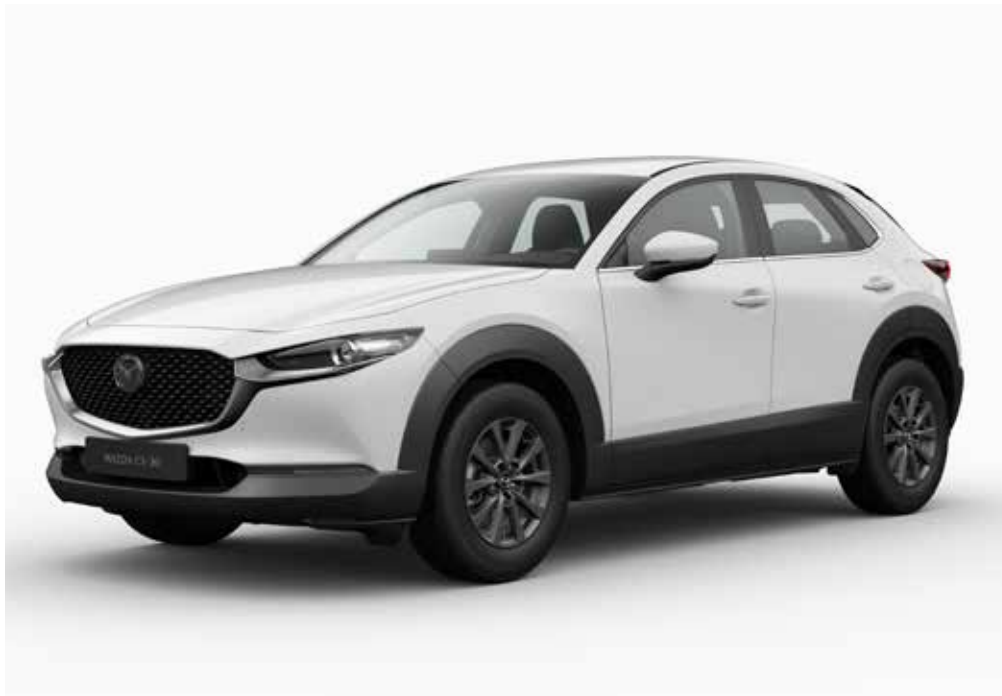
Foto: Mazda CX-30 in Arctic White