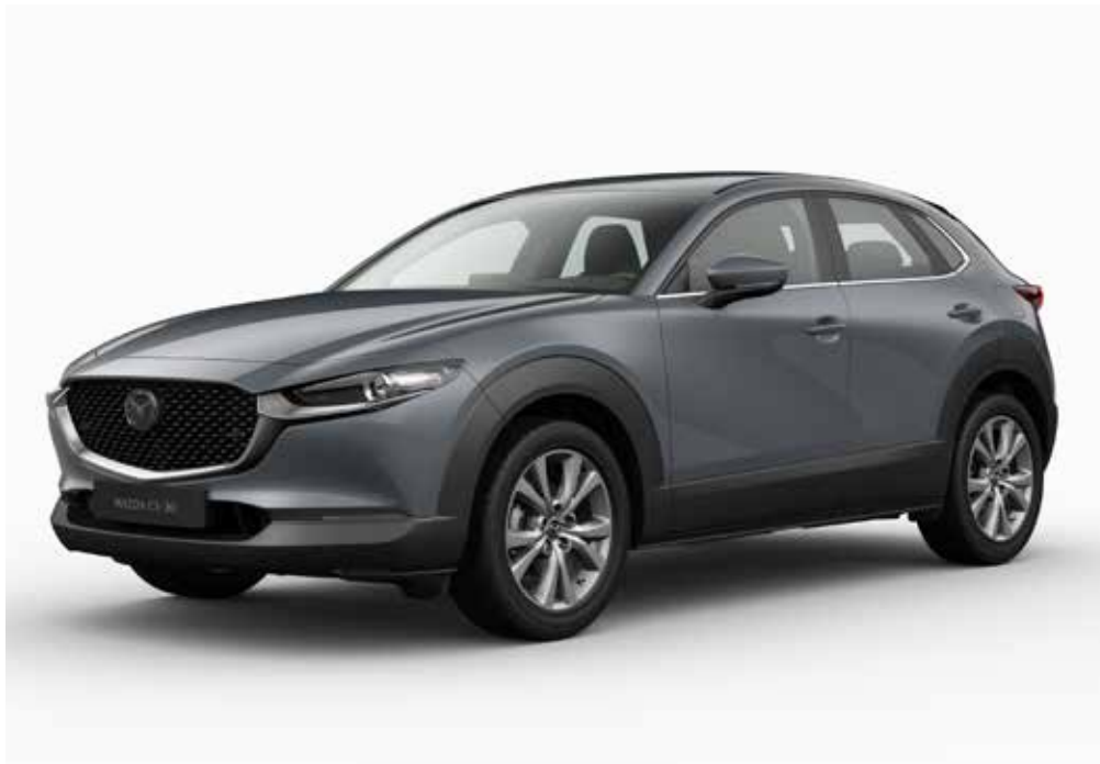
Foto: Mazda CX-30 in Polymetal Grey