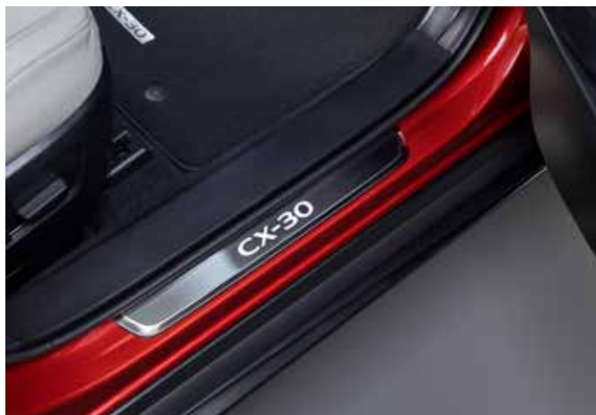
VERLICHTE DORPELBESCHERMERS € 610