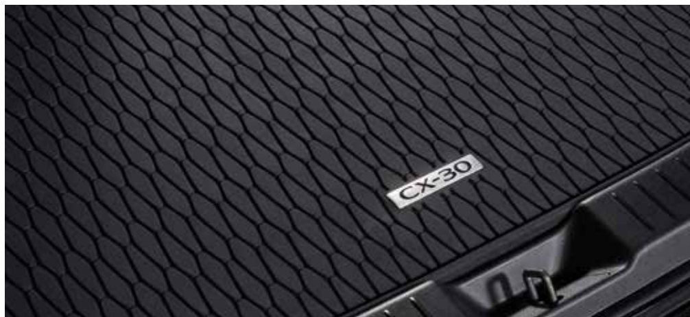
RUBBEREN KOFFERBAKMAT € 165

De prijzen en specificaties geven een beperkt overzicht van ons totale aanbod aan accessoires. Ga voor meer informatie over het volledige assortiment accessoires dat wij bieden naar www.mazda.nl/configurator , selecteer de gewenste auto en kies vervolgens Extra opties. De getoonde prijs is een niet-bindende adviesprijs van Mazda Motor Nederland, kan worden gewijzigd en is mogelijk exclusief extra's zoals lak. Lichtmetalen velgen zijn exclusief banden. De montagekosten voor accessoires kunnen per Mazda dealer verschillen. Neem contact op met je dealer voor meer informatie over originele accessoires van Mazda, de meest recente prijzen en eventuele afwijkende montagekosten.