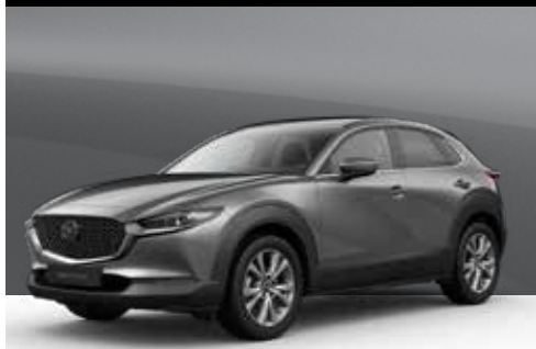
MACHINE GREY | € 1.050