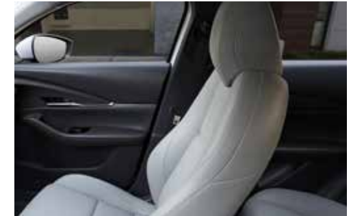
Pure White lederen interieur (mogelijk op e-Skyactiv X)