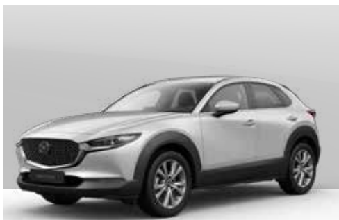
ARCTIC WHITE | € 0