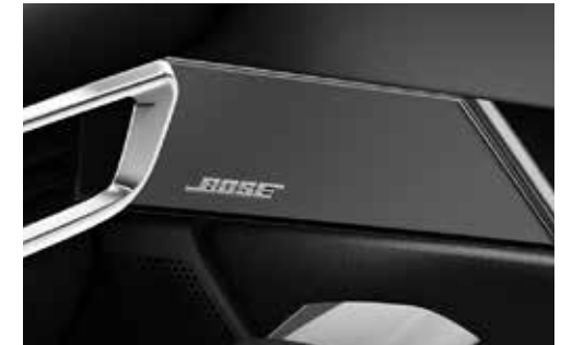
Bose® premium-audiosysteem met 12 designspeakers met Gloss Black-afwerking