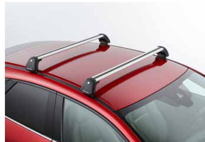
DWARSDRAGERS € 350