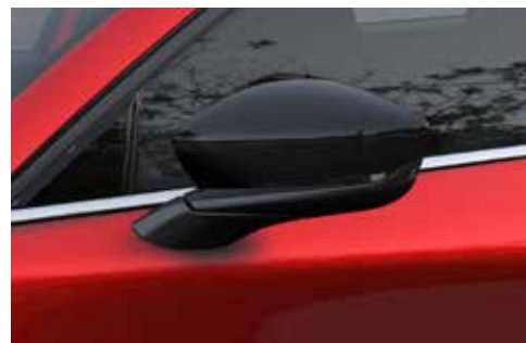
Buitenspiegelkappen in Black