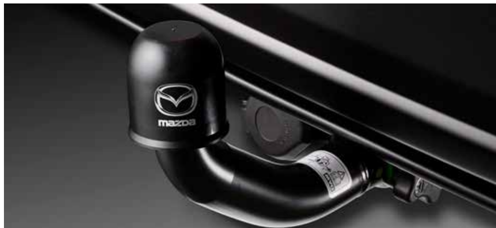
AFNEEMBARE TREKHAAK € 1.245