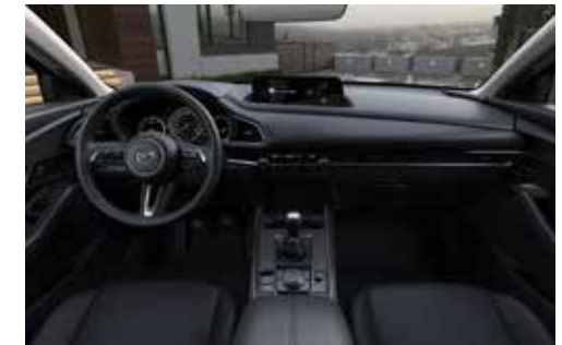
Dashboard met afwerking in Bright Silver