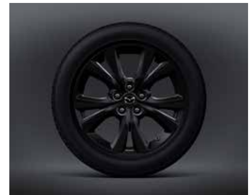
18-INCH LICHTMETALEN VELGEN, BLACK