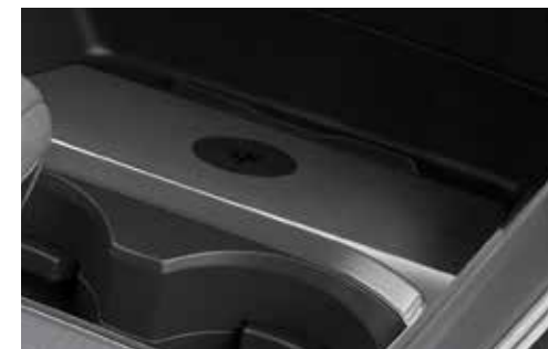
Qi draadloos opladen