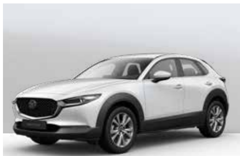
SNOWFLAKE WHITE | € 850