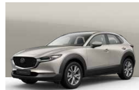
PLATINUM QUARTZ | € 850