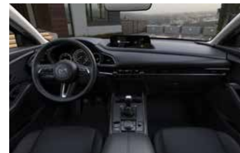
Zwart stoffen interieur met rood stiksel