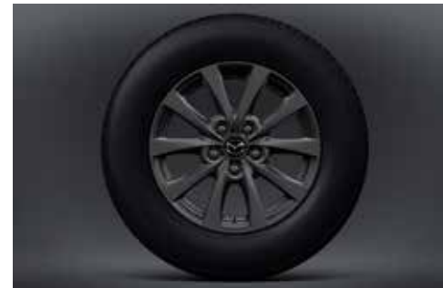
16-inch lichtmetalen velgen in Grey